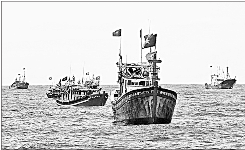
Hội Nghề cá Việt Nam đề nghị các cơ quan chức năng có biện pháp phản đối mạnh mẽ nhằm ngăn chặn, chấm dứt hành động ngang ngược của Trung Quốc

liệt phản đối hành động hết sức phi lý của phía Trung Quốc. Quy chế này không có giá trị pháp lý đối với các vùng biển thuộc chủ quyền của Việt Nam. Ngư dân Việt Nam hoàn toàn có quyền đánh bắt trên các vùng biển thuộc chủ quyền của Việt Nam.