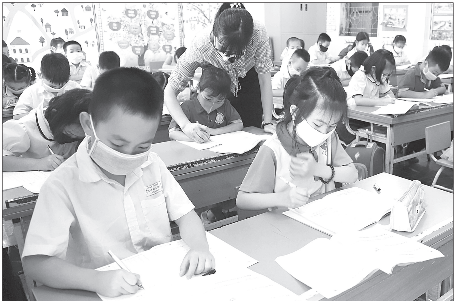
Giáo viên, học sinh các lớp ở Trường Tiểu học Cẩm Thượng (TP Hải Dương) đeo khẩu trang trong giờ học

Trong ngày đầu tiên đi học trở lại, học sinh tiểu học đến lớp cơ bản đầy đủ trong khi còn khá nhiều trẻ mầm non vẫn nghỉ. Các trường đã thực hiện tốt công tác phòng chống dịch Covid-19, bảo đảm an toàn cho trẻ. Trang 3