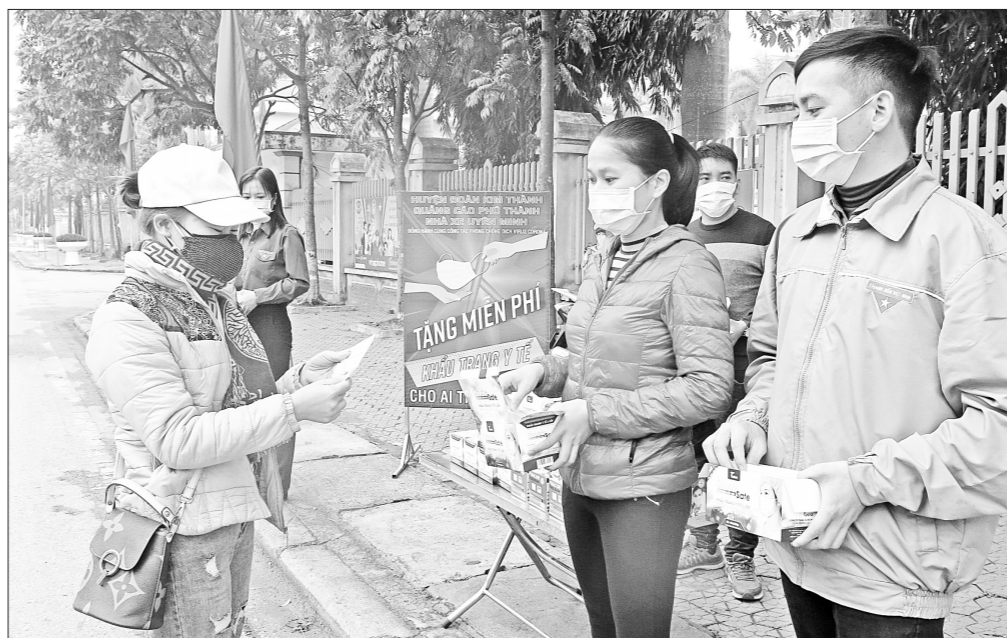
Theo Chủ tịch Hồ Chí Minh, thanh niên phải là những đội xung phong trên các mặt trận chính trị, kinh tế, khoa học, kỹ thuật. Trong ảnh: Đoàn viên thanh niên huyện Kim Thành hoạt động tình nguyện trong mùa dịch Covid-19.

Chủ tịch Hồ Chí Minh chỉ rõ: Đảng sống trong xã hội, là một bộ phận hợp thành cơ cấu của xã hội. Tổ chức đảng và mỗi cán bộ đảng viên ở các cấp, giữ các chức vụ đều chịu ảnh hưởng, tác động của môi trường, các quan hệ xã hội, cả cái tốt và cái xấu, cái tích cực, tiến bộ và cái tiêu cực, lạc hậu. Do đó, tổ chức đảng và mỗi cán bộ, đảng viên phải thường xuyên rèn luyện. Đảng