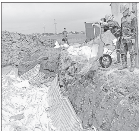
Toàn bộ số nội tạng không rõ nguồn gốc bị tiêu hủy

Ông Lợi chỉ cho thuê kho chứa. Quá trình điều tra, lực lượng chức năng xác định số hàng trên không có nguồn gốc, xuất xứ, được ông Huy thu mua từ nhiều nguồn khác nhau để bán lại cho người khác có nhu cầu.