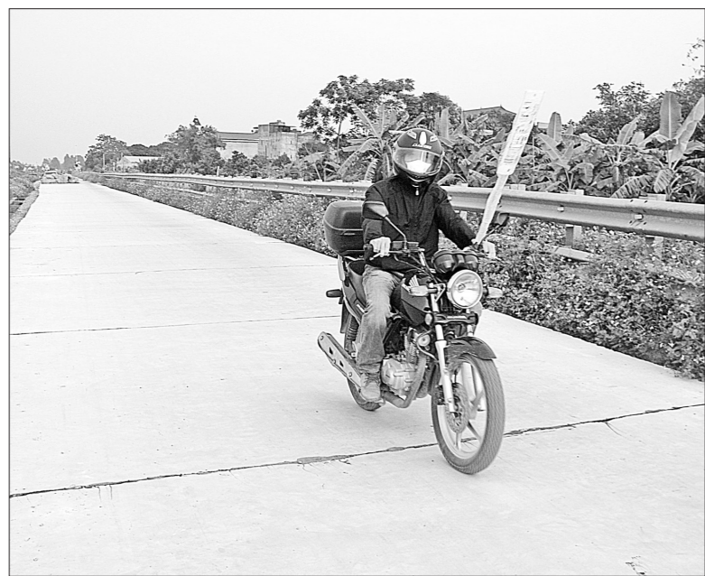
Tuyến đường 19 đã hoàn thành giai đoạn 1

Huyện Cẩm Giàng hiện có 4 CCN với tổng diện tích hơn 164 ha.