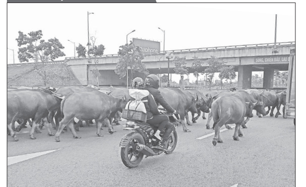
Đàn trâu thông dong trên quốc lộ 38B đoạn qua thị trấn Gia Lộc. Ảnh chụp lúc 17 giờ ngày 3.5