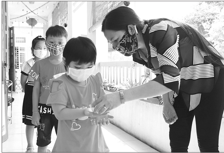
Giáo viên hướng dẫn trẻ rửa tay sát khuẩn trước khi vào lớp

Nhiều người lo trẻ mầm non khi trở lại trường sẽ khó thực hiện tốt quy định phòng chống dịch Covid-19. Nhưng thực tế cho thấy các trường đều đã lên kế hoạch để khắc phục khó khăn này. Sáng 4.5, Trường Mầm non Ngọc Sơn (TP Hải Dương) đón 221 trẻ đi học trở lại. Từ sáng sớm, tất cả cán bộ, giáo viên, nhân viên đã có mặt tại khu vực cổng trường để đón trẻ. Sau khi đo thân nhiệt trẻ, giáo viên hướng dẫn các bé đi theo hàng (mỗi hàng tối đa 5 bé) đến cửa lớp học, trẻ sẽ rửa tay sát khuẩn trước khi vào trong. Trong lớp, học sinh đeo khẩu trang, giữ khoảng cách tối thiểu 1 m trong lúc học, ăn, khi ngủ trưa.